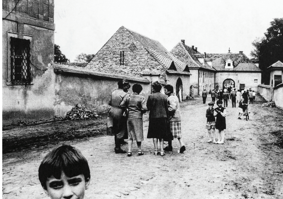
Dzieci deportowanych z Luksemburga w Bramie klasztornej Leubus