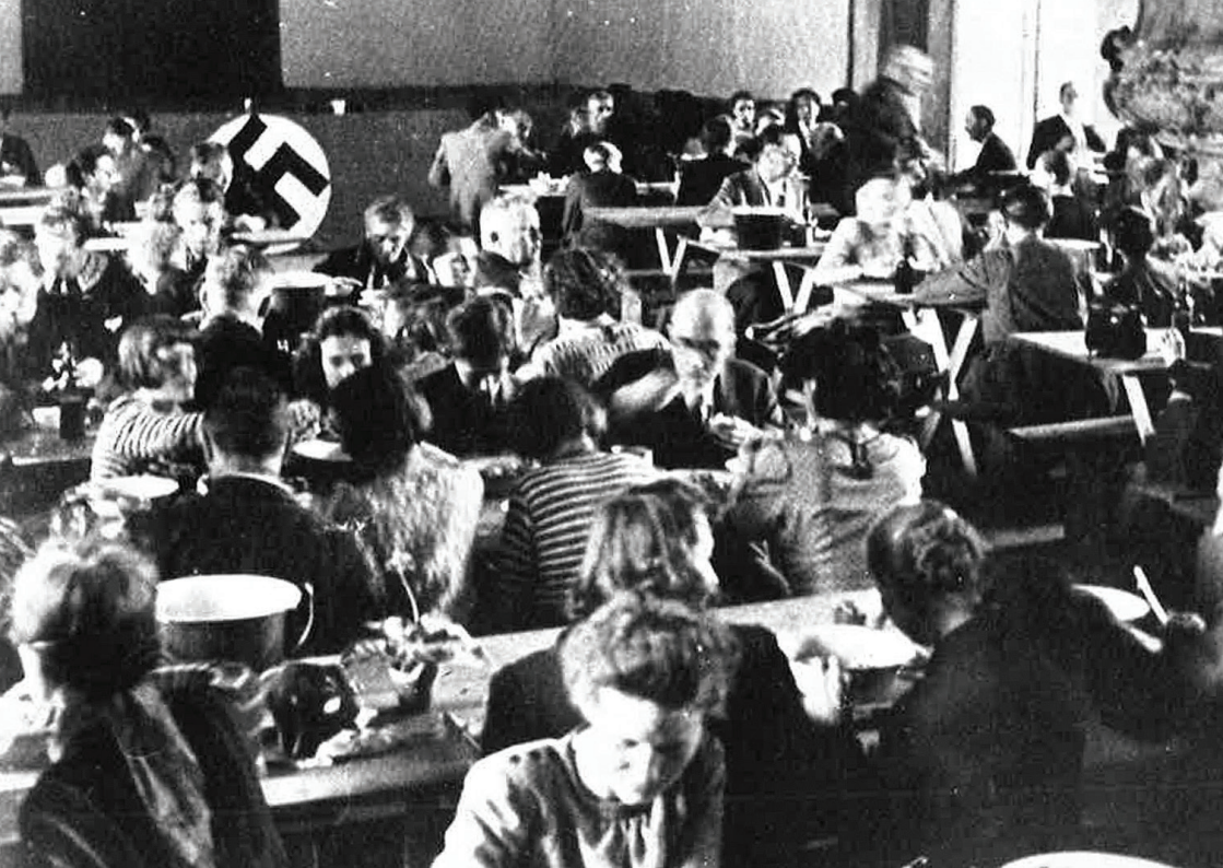
Obiad dla deportowanych z Luksemburga w Leubus